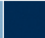
599 New Orleans Blau