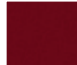
163 Bolero Rot